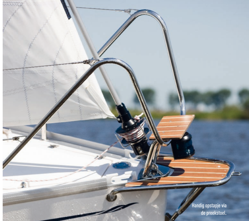
Handig opstapje via de preekstoel.

Wegverkeer hier nog een oogje dichtknijpt. Eventueel kan de boot licht gekanteld op de trailer geplaatst worden, zoals je ook bij brede catamarans ziet. Het schip is verkrijgbaar in maar liefst drie verschillende kielvarianten: vaste kiel, hefkiel en zwenkkiel. En eigenlijk zijn het vier varianten, de vaste kiel is namelijk leverbaar in een diepe en ondiepere uitvoering. Iedere kiel heeft een bijpassend ballastpercentage, met als gevolg enige variatie in het totale scheepsgewicht. Het testschip is uitgevoerd met een wegklapbare zwenkkiel en voorzien van 600 kg binnenballast. De andere kielvarianten hebben de ballast in de kiel en kunnen toe met minder kilo's. Ook de waterverplaatsing is dan minder. Toch geeft Wilko Dijkstra van Noël Jachtverhuur aan zich vooral te willen focussen op de zwenkkiel. Weggeklapt verdwijnt deze volledig in de romp. Op de trailer, met de zwenkkiel omhoog zien we dit overduidelijk terug in een vloeiend onderwaterschip, zonder belemmeringen, zeer geschikt voor droogvallen of een dagje ankeren bij een strandje. Naar huidige maatstaven is de romp smal en oogt gestrekt. En met een lengte-breedteverhouding van circa 3 op 1 is hij dat ook. De voorvoet van de romp is licht concaaf (bol) voor een betere aansnijding van het water. Wel kost dit enig volume voorin, dus om onder zeil te veel