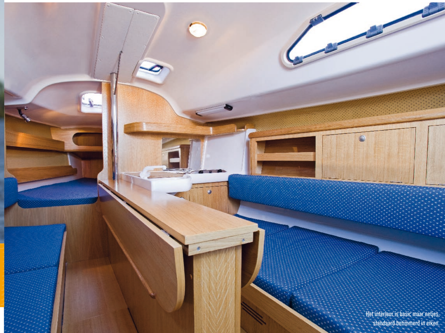
Het interieur is basic maar netjes, standaard-betimmerd in eiken.