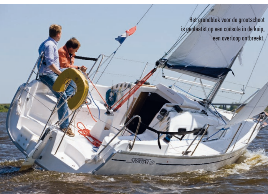
Het grondblok voor de grootschoot is geplaatst op een console in de kuip, een overloop ontbreekt.

vertrimming voorover te voorkomen, blijft tijdig reven het motto.